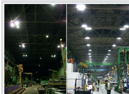
Цех ДО модернизации системы освещения

с 74800 до 22620 кВтч. В итоге весной 2011 года «ЭНЕРГИЯ ХОЛДИНГ» и ООО «ИЗ-КАРТЕКС» заключили договор на установку еще 190 светодиодных светильников. Гарантийный срок по контракту – три года, но, как заявляют производители оборудования, безребойная работа будет обеспечена на протяжении 10 лет.